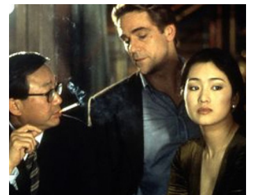
1997 CHINESE BOX (Chinese Box) de Wayne Wang avec Gong Li