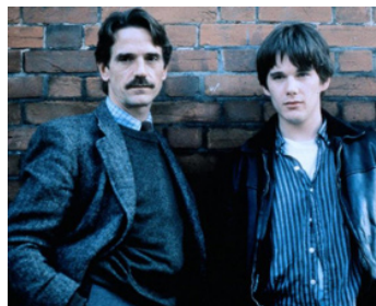
1992 WATERLAND (Waterland) de Stephen Gyllenhaal avec Ethan Hawke