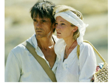
2002 AND NOW... LADIES AND GENTLEMEN de Claude Lelouch avec Patricia Kaas