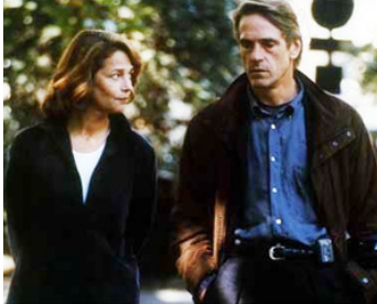
2001 VENGEANCE SECRÈTE (The Fourth Angel) de John Irvin avec Charlotte Rampling