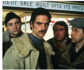
1982 TRAVAIL AU NOIR (Moonlighting) de Jerzy Skolimowski avec Eugene Lipinski