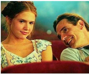
1997 LOLITA (Lolita) d'Adrian Lyne avec Dominique Swain