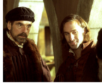
2004 LE MARCHAND DE VENISE (The Merchant of Venice) de M. Radford avec Joseph Fiennes