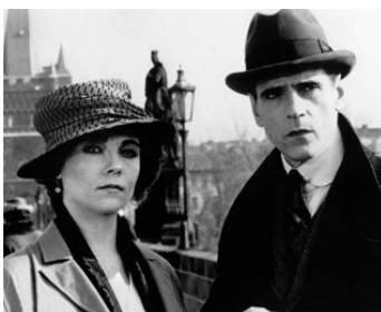
1991 KAFKA (Kafka) de Steven Soderbergh avec Theresa Russell