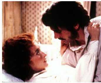
1981 LA MAÎTRESSE DU LIEUTENANT FRANÇAIS (The French Lieutenant's Woman) de K. Reisz avec M. Streep