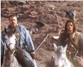
2005 KINGDOM OF HEAVEN (Kingdom of Heaven) de Ridley Scott avec Orlando Bloom