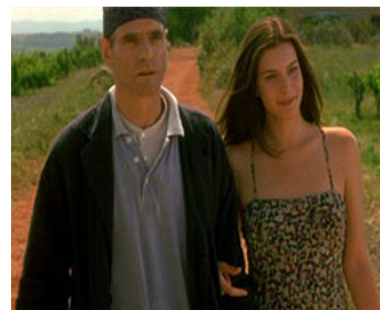
1996 BEAUTÉ VOLÉE (Stealing Beauty) de Bernardo Bertolucci avec Liv Tyler