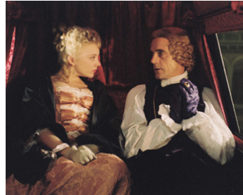
2005 CASANOVA (Casanova) de Lasse Hallström avec Natalie Dormer