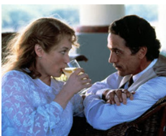
1993 LA MAISON DES ESPRITS (The House of the Spirits) de Bille August avec Meryl Streep