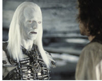
2002 LA MACHINE À EXPLORER LE TEMPS (The Time Machine) de Simon Wells