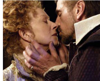
2005 ELIZABETH I (Elizabeth I) de Tom Hooper avec Helen Mirren