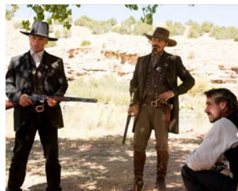
2008 APPALOOSA (Appaloosa) d'Ed Harris avec Viggo Mortensen, Ed Harris