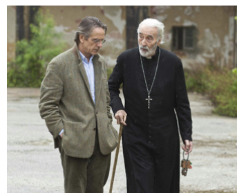
2013 TRAIN DE NUIT POUR LISBONNE (Night Train to Lisbon) de Bille August avec Christopher Lee