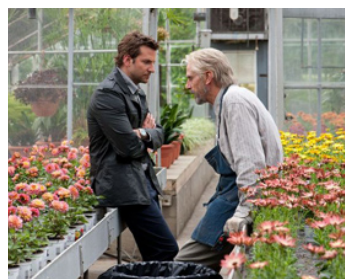
2012 THE WORDS (The Words) de Brian Klugman et Lee Sternthal avec Bradley Cooper