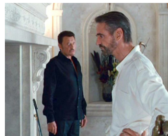
2009 LA PANTHÈRE ROSE 2 (The Pink Panther 2) de Harald Zwart avec Johnny Halliday