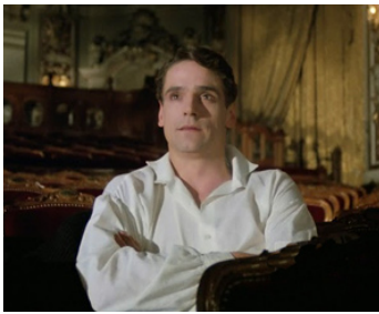
1980 NIJINSKI (Nijinski) de Herbert Ross