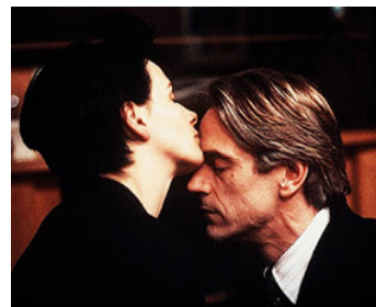
1992 FATALE (Damage) de Louis Malle avec Juliette Binoche