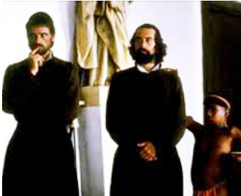
1986 MISSION (The Mission) de Roland Joffé avec Robert De Niro