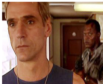
1995 UNE JOURNÉE EN ENFER (Die Hard with a Vengeance) de J. McTiernan avec Samuel Jackson