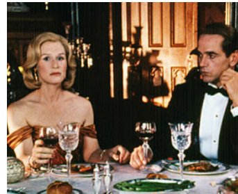
1990 LE MYSTÈRE VON BULOW (Reversal of Fortune) de Barbet Schroeder avec Glenn Close