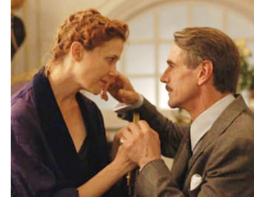
2004 ADORABLE JULIA (Being Julia) de Istvan Szabo avec Annette Bening