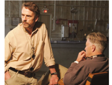
2006 INLAND EMPIRE (Inland Empire) de et avec David Lynch