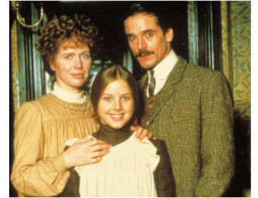
1984 LE CANARD SAUVAGE (The Wild Duck) de Henri Safran avec Liv Ullman