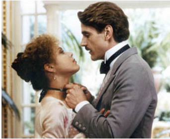
1983 UN AMOUR DE SWANN de Volker Schlöndorff avec Ornella Muti