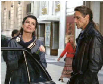
2002 CALLAS FOREVER (Callas Forever) de Franco Zeffirelli avec Fanny Ardant