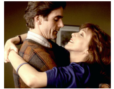
1983 TRAHISONS CONJUGALES (Betrayal) de David Hugh Jones avec Patricia Hodge