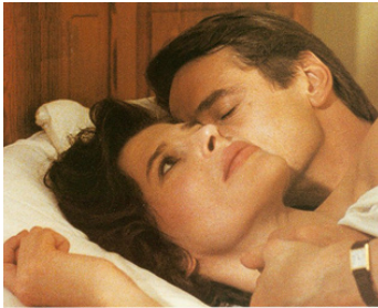
1989 AUSTRALIA de Jean-Jacques Andrien avec Fanny Ardant