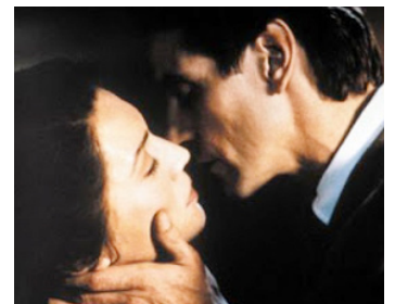
1993 M. BUTTERFLY (Mr Butterfly) de David Cronenberg avec John Lone