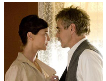
2009 UN LORD EN DISGRACE (Georgia O'Keefe) de Bob Balaban avec Joan Allen