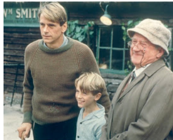
1989 DANNY, CHAMPION DU MONDE (Danny...) de Gavin Millar avec Robbie Coltrane