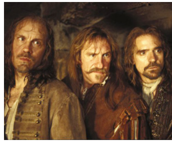
1998 THE MAN IN THE IRON MASK de Randall Wallace avec John Malkovich, Gérard Depardieu