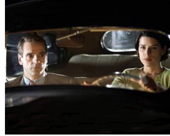
2002 LAST CALL (Last Call) de Henry Bromell avec Neve Campbell