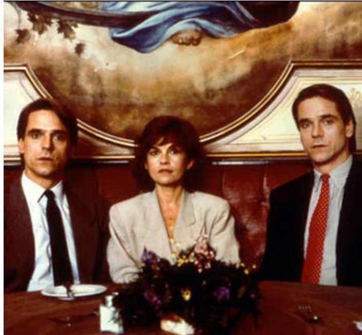
1988 FAUX SEMBLANTS (Dead Ringers) de David Cronenberg avec Geneviève Bujold